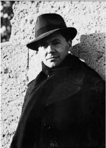
Portrait de Jean Moulin. Contretype d'une photographie prise en 1939.

L'entre-deux-guerres a ravivé le culte des héros, plus particulièrement dans les régimes totalitaires qui visent à construire l'« homme nouveau ». Ouvrier modèle en URSS, surhomme racialement pur dans l'Allemagne nazie, les représentations monumentales témoignent de la volonté de puissance de ces régimes. La guerre d'Espagne (1936-1939) met en scène l'affrontement entre les modèles héroïques rivaux des dictatures et des démocraties avant que le monde ne plonge dans l'horreur généralisée de la Seconde Guerre mondiale. Le héros naît nécessairement dans les temps de crise, de conflit, de catastrophe, et la dernière grande figure héroïque nationale en France est bien celle du résistant, comme l'indiquent un certain nombre de marqueurs (noms de rues, de places, de stations de métro, de cérémonies mémorielles, d'expositions patrimoniales, la place essentielle de l'Occupation dans les programmes scolaires, la production littéraire et cinématographique sur ce thème...). Les débats qui, depuis la guerre, ont agité l'opinion publique autour des figures de la Résistance, témoignent aussi de l'extrême sensibilité que nous éprouvons à l'égard de cette matrice morale nationale. Dans Le Trait empoisonné , Pierre Vidal-Naquet rappelait, à propos des attaques dont Jean Moulin a fait l'objet dans les années